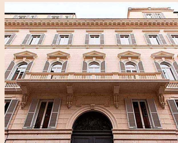
Fachada del edificio.

A&G Banca Privada cuenta con un equipo de más de 100 banqueros privados y una red de oficinas distribuidas en 11 ciudades de España, además de una gestora de activos en España y otra en Luxemburgo.